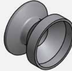
CONCENTRIC REDUCERS WITH FERRULE KONZENTRISCHE REDUZIERUNGEN MIT STUTZEN