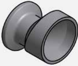
EXCENTRIC REDUCERS WITH FERRULE EXZENTRISCHE REDUZIERUNGEN MIT STUTZEN